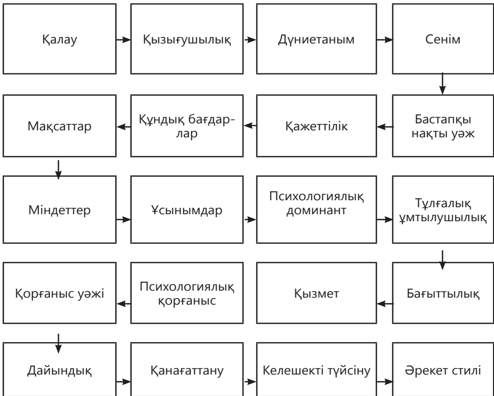
Адам әрекеті қалыптасуының психологиялық тетігі

Адамның сыбайлас жемқорлық әрекетінің психологиялық тетігін сипаттау мақсатында адамның әлеуметтік әрекетінің қандай бар бір нысанын қалыптастыратын құрылымдық элементтерді мен олардың өзара байланыс және өзара әрекет схемаларын, психикалық процестердің жүру себептерін, заңдылығын, серпінін айқындайтын модель әзірленді. Бұл модель төменде схема түрінде ұсынылған.